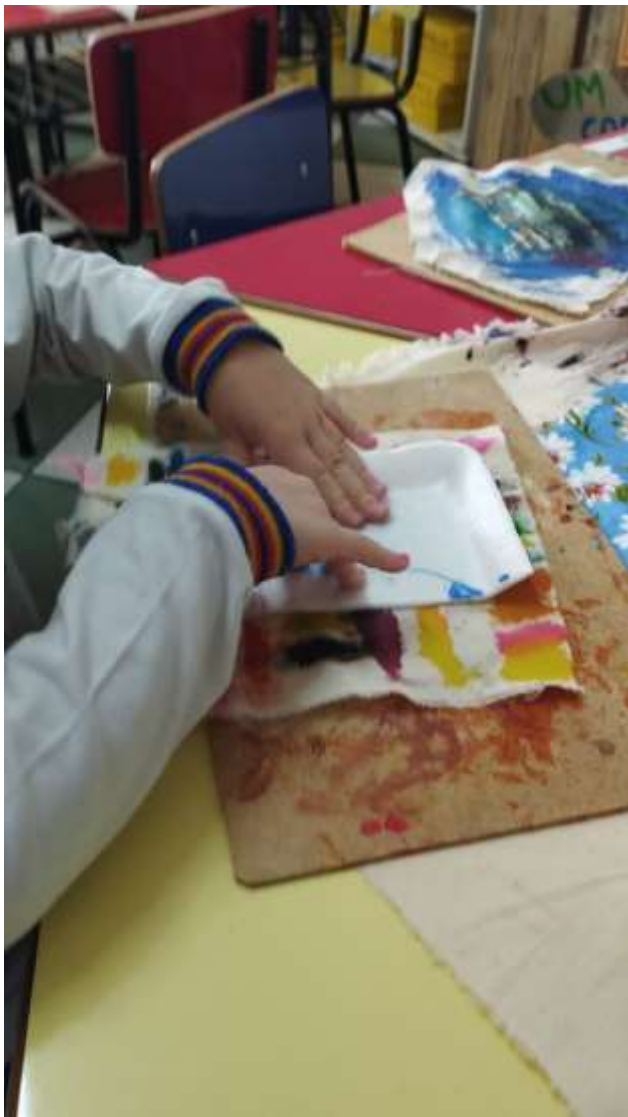
“Nossa Prô, parece um carimbo!” P.M.