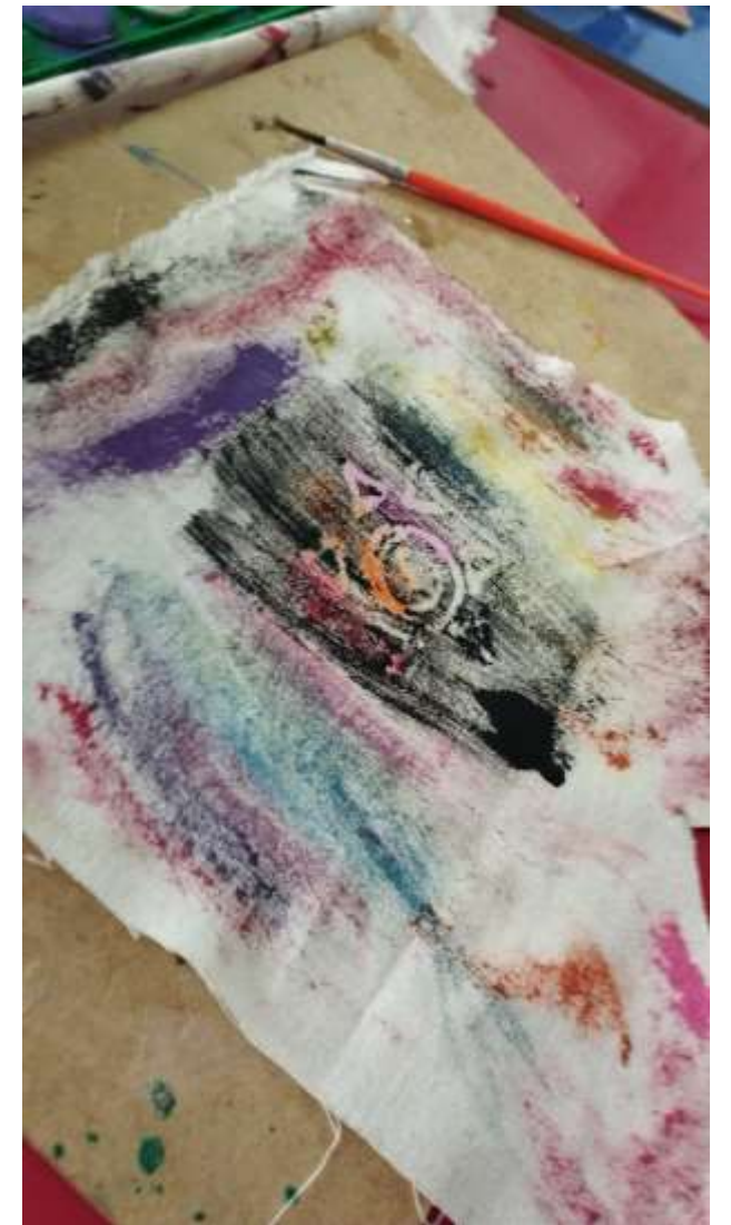
“Aperta, aperta, aperta!” B.N. exclamou enquanto carimbava sua bandeirinha.